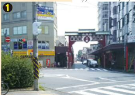
川崎大師仲見世・表参道