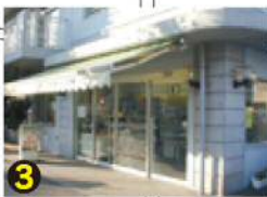
ゆずりは園/ 障がい者作業所: 製パン、製菓 営業時間 10:00~15:30 定休 土・日・祝